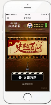
再忆四史 (四史答题) Recalling the four histories again (Q&A activities)