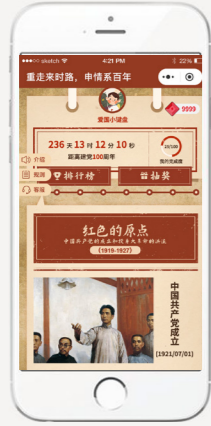
跨越百年 (申能) Over 100 years (Shenergy Group)