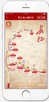
重走长征 (民生) Take the Long March again (CSMB)